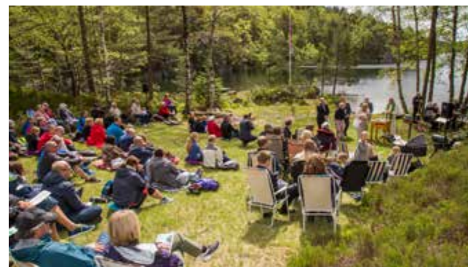
Skogsmesse ved Drangsholtvann i juni