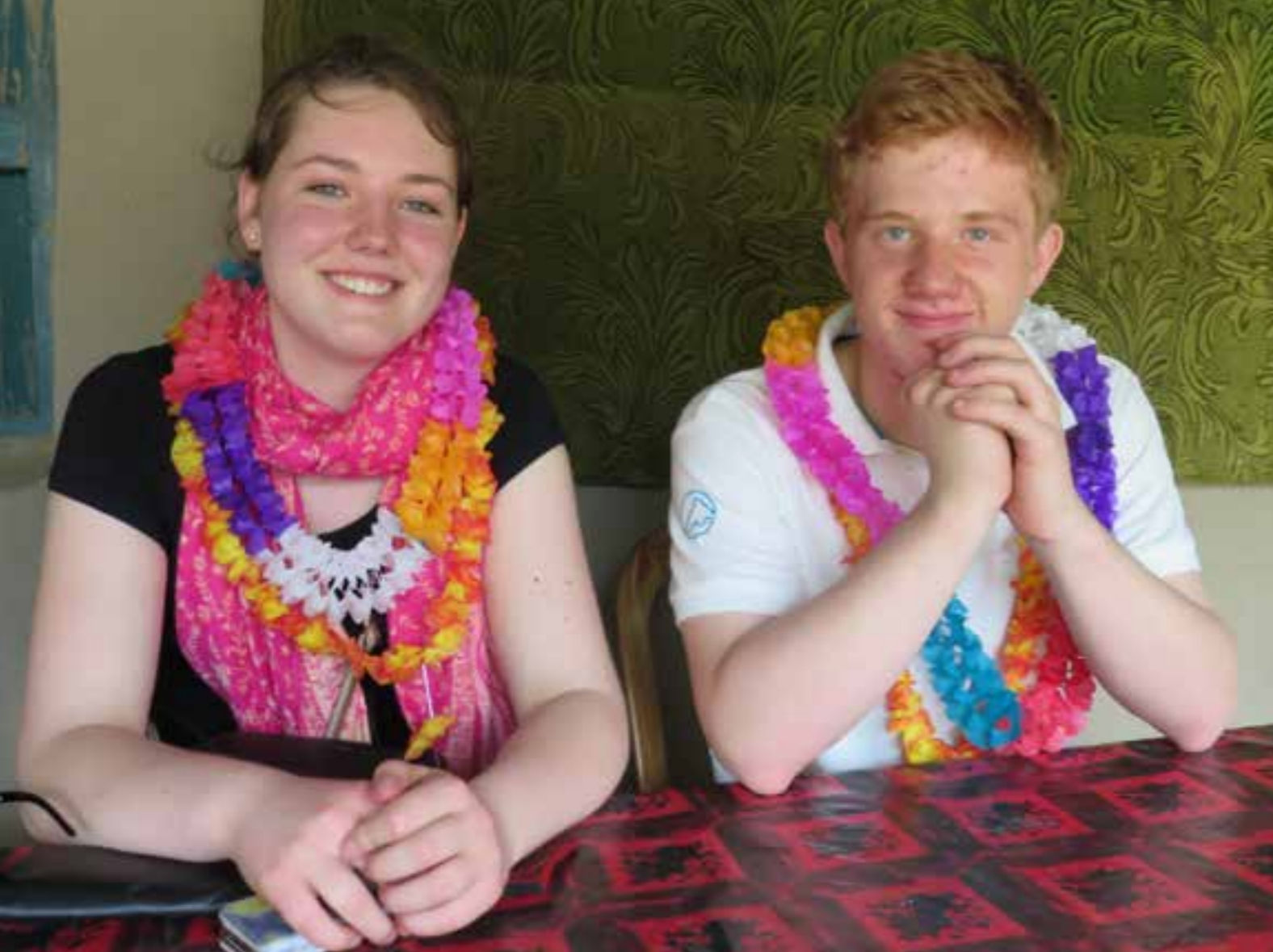
Vi ble ønsket velkommen med blomsterkranser. Det ble mange blomster og kranser etterhvert!